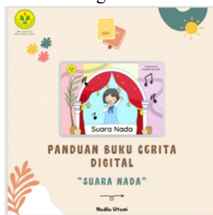
Gambar 4. Buku Panduan Digital “Suara Nada”

Setelah buku sudah selesai dikembangkan dalam bentuk gambar digital, sebelum lanjut ke tahap implementasi, produk yang dikembangkan dievaluasi oleh ahli materi dan ahli media. Hasil evaluasi yaitu penyederhanaan dialog dari buku cerita. Hasil dari evaluasi tersebut dijadikan sebagai masukan untuk mereview produk. Agar sesuai dengan hasil analisa yang sudah dilakukan pada tahap awal, gambar digital yang telah selesai dikumpulkan dan disusun menjadi sebuah buku lengkap dan diubah menjadi format Portable Document Format (PDF) untuk lebih lanjut produk divalidasi dan siap untuk diimplementasikan pada tahap selanjutnya. Pada tahap ini, peneliti juga mengembangkan desain dari buku panduan buku cerita digital.