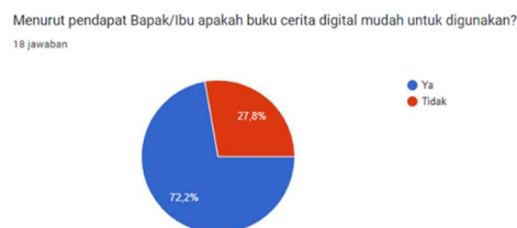
Gambar 2. Hasil Kuesioner 2

Sebanyak 72.2% responden berpendapat bahwa buku cerita digital mudah untuk digunakan. Sebanyak 27,8% responden berpendapat bahwa buku cerita digital sulit untuk digunakan. Lebih lanjut sebanyak 72,2% responden setuju bahwa penggunaan media digital dibutuhkan khususnya buku cerita digital bagi orangtua ataupun pendidik dalam menstimulasi kepercayaan diri anak. Sebanyak 27,8% responden tidak setuju bahwa penggunaan media digital dibutuhkan khususnya buku cerita digital bagi orangtua maupun pendidik dalam menstimulasi kepercayaan diri anak. Berdasarkan hasil angket disimpulkan tujuan dari penelitian ini yaitu perlunya dilaksanakan pengembangan media buku digital yang dapat digunakan dan diakses oleh guru maupun orangtua dengan topik terkait dengan stimulasi kepercayaan diri anak usia dini untuk bisa dijadikan media