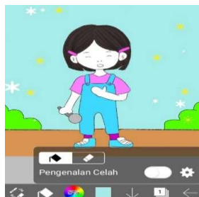
Gambar 3. Proses Pewarnaan dengan menggunakan Ibis Paint

Pada tahap ini semua bentuk rancangan yang telah disiapkan kemudian dikembangkan dalam bentuk digital melalui proses menggambar, mewarnai, dan menambahkan berbagai objek gambar dengan menggunakan aplikasi Ibis Paint . Setelah gambar digital telah selesai, dialog dan narasi cerita ditambahkan menggunakan aplikasi canva .