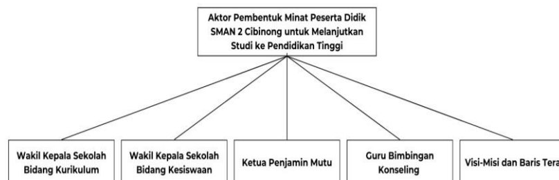
Gambar 1. Aktor Pembentuk Minat Peserta Didik SMAN 2 Cibinong untuk