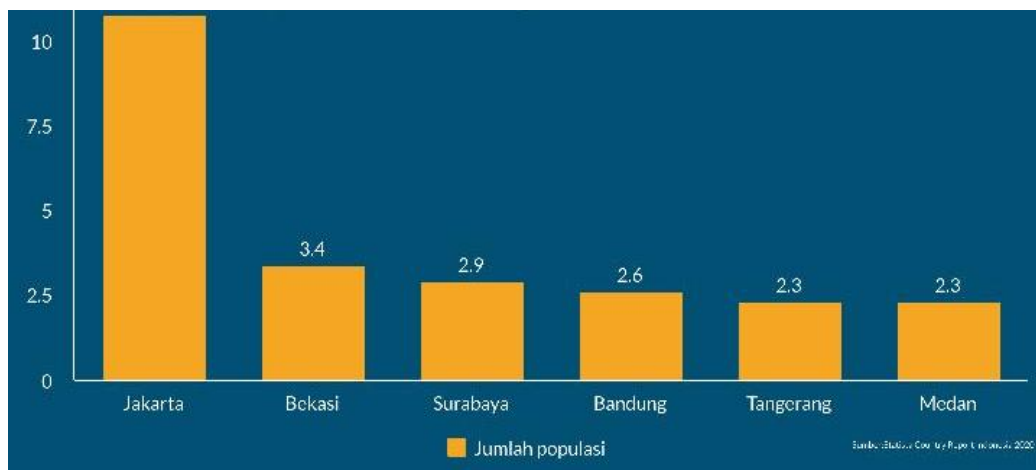
Gambar 2. Jakarta sebagai Kota dengan Tingkat Urbanisasi Tertinggi

Di Jakarta, sebagai jantung metropolitan, dengan tingkat urbanisasi terbesar di Indonesia, telah menjadi episentrum fashion di negara ini menunjukkan barometer utama yang kuat dalam mengamati dinamika tren berkain di Generasi Z. Tingginya tingkat interaksi sosial, keberagaman budaya, serta paparan terhadap arus globalisasi yang meluas menjadikan kota Jakarta sebagai ruang yang dinamis bagi lahirnya bentuk-bentuk ekspresi budaya baru.