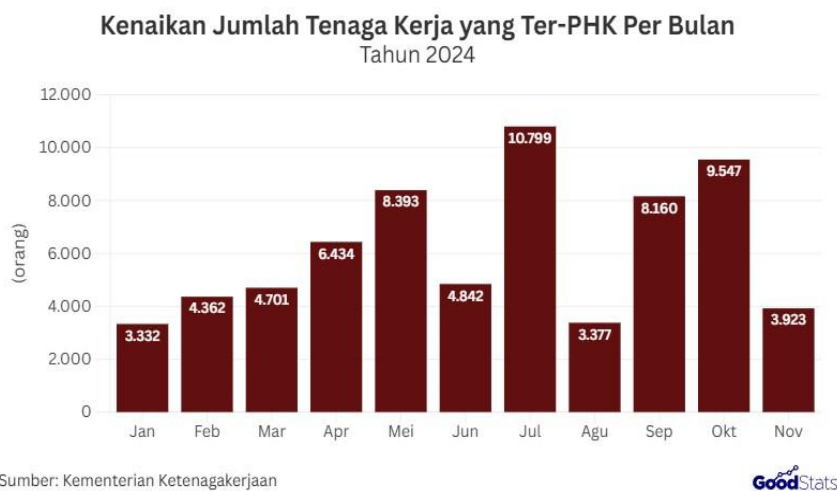
Gambar 1. Data Jumlah Korban PHK di Indonesia Per-Bulan Tahun 2024

Pemutusan Hubungan Kerja (PHK) secara besar-besaran pada dunia industri merupakan suatu fenomena yang seringkali terjadi pada konteks ketenagakerjaan yang kerap berdampak pada sektor sosial dan ekonomi (Oemar Atallah, 2024). Berdasarkan data yang dipaparkan oleh Kementerian Ketenagakerjaan Republik Indonesia (Kemenaker), pada tahun 2024, sebanyak 77.965 orang tenaga kerja tercatat mengalami PHK. Di luar data tersebut, Kemenaker juga menemukan ada sekitar 60 perusahaan yang berpotensi melakukan PHK massal,