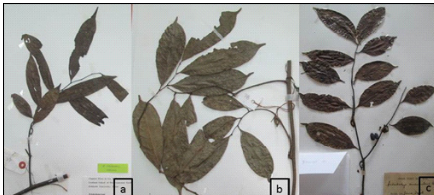
Gambar 2. Variasi morfologi daun A. suaveolens , a. lanset; b. membundar telur sung-sang, c. jorong dan memanjang (a&b: Uchida U45 dan U56, c: Beumèè s.n.).