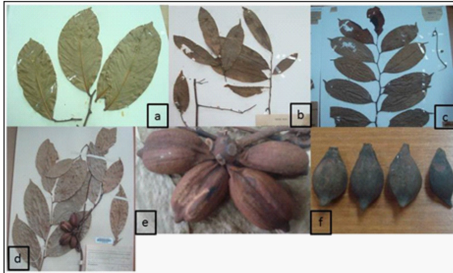
Gambar 1. Variasi morfologi daun dan buah A. hexapetalus : I.Variasi daun. kelompok pertama (a), memiliki daun dengan ukuran besar dan tulang daun sangat menonjol; kelompok kedua (b.) memiliki daun ukuran sedang dengan tulang daun menonjol; kelompok ketiga (c) memiliki daun ukuran sedang dengan tulang daun sangat menonjol; II. variasi buah. buah yang sudah tua berukuran besar (e) ; buah yang masih muda berukuran lebih kecil (f); III. variasi antara kelompok I dan II.daun berukuran sedang tetapi buahnya besar (d). (Spesimen a: Forbes 332, b: Teysmann 8770, d&e: Lutjeharms 4357, f: N.G. 523).

dengan membuat rekonstruksi pohon fenetik menggunakan program NTSYSpc Version 2.02i. Matriks similaritas dikomputasi dengan memperhitungkan jarak antar takson secara kualitatif (SimQual dalam NTSYSpc). Clustering (pengelompokkan) dikomputasi dengan program SAHN dalam NTSYSpc menggunakan metode UPGMA.