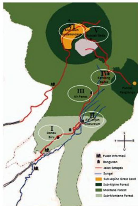
Gambar 1. Lokasi pengamatan semut di sepanjang Jalur Pendakian Cibodas, TNGGP

Alat dan bahan yang digunakan di antaranya botol koleksi, pinset, cawan petri, sekop, kertas label, kotak koleksi, kaca pembesar, mistar, mikroskop stereo, kamera digital Fuji Film Finepix T200 14 mega pixels, kertas minyak, kertas label, kompas, altimeter Sunoh SAL7020, soil pH tester Takemura DM-13, weather meter Kestrel 3000, Global Positioning System (GPS) Garmin eTrex Legend Cx, aquades, alkohol 70%, dan gliserin.