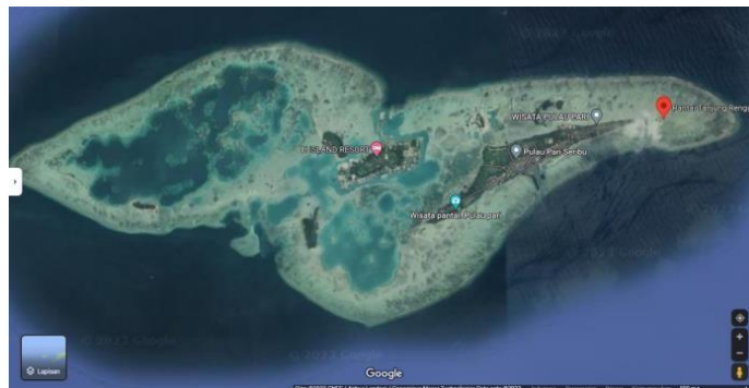
Gambar 1. Pantai Rengge, Pulau Pari, Kepulauan Seribu, DKI Jakarta

Penelitian ini dilakukan pada bulan Desember 2022 di perairan pantai Rengge, pulau Pari, Kepulauan Seribu, Jakarta Utara. Pengamatan dilakukan pada sore hari sekitar pukul 14.00-16.00 WIB dengan kondisi cuaca cerah. Alat dan bahan yang digunakan dalam penelitian ini adalah meteran, plastik sampel, alkohol 70%, mikroskop cahaya dan alat tulis yang menunjang penelitian.