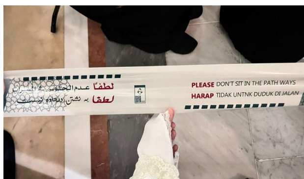
Figure 3 Himbauan untuk Tidak Duduk di Jalan

Lebih jauh, bahasa Indonesia memiliki fungsi integratif dan edukatif. Secara integratif, ia memperlihatkan hubungan harmonis antara nilai-nilai Islam dan identitas bangsa Indonesia yang religius dan toleran. Secara edukatif, penggunaan bahasa Indonesia membantu jamaah memahami konteks ibadah dan tata tertib dengan lebih baik, sekaligus memperkuat literasi global (Ridho, 2024). Dengan demikian, lanskap linguistik Masjid Nabawi dapat dilihat sebagai wujud nyata diplomasi budaya lintas bangsa yang didukung oleh simbol bahasa, termasuk Urdu, Farsi, dan Indonesia yang sama-sama menjadi jembatan antarbudaya umat Muslim dunia.