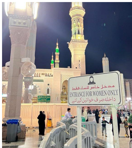
Figure 1 Papan penanda pintu masuk khusus perempuan

Keberadaan kelima bahasa ini menggambarkan komitmen otoritas masjid terhadap komunikasi lintas budaya dan kemudahan ibadah bagi seluruh umat. Selain fungsi informatif, kombinasi bahasa juga mencerminkan hubungan diplomatik antarnegara Muslim melalui simbol linguistik yang harmonis (Alsaif & Starks, 2019).