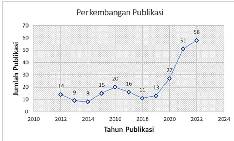
Gambar 2. Perkembangan Publikasi terkait Komunikasi dalam Lingkungan Pembelajaran Online

Gambar 2 menunjukkan bahwa jumlah publikasi terkait topik ini mengalami fluktuasi dari tahun 2012-2019 dengan jumlah tertinggi mencapai 20 artikel yakni pada tahun 2016 dan jumlah terendah adalah 8 yakni pada tahun 2014. Selanjutnya tren publikasi terkait topik ini terus naik yakni menjadi 27 publikasi pada tahun 2020 dan kemudian meningkat secara dramatis hingga mencapai 51 publikasi pada tahun 2021 dan terus meningkat hingga mencapai 58 publikasi pada bulan Desember tahun 2022 pada saat studi ini dilaksanakan. Peningkatan yang signifikan pada tahun 2021 juga sejalan dengan populernya model pembelajaran online selama masa pandemi COVID-19.