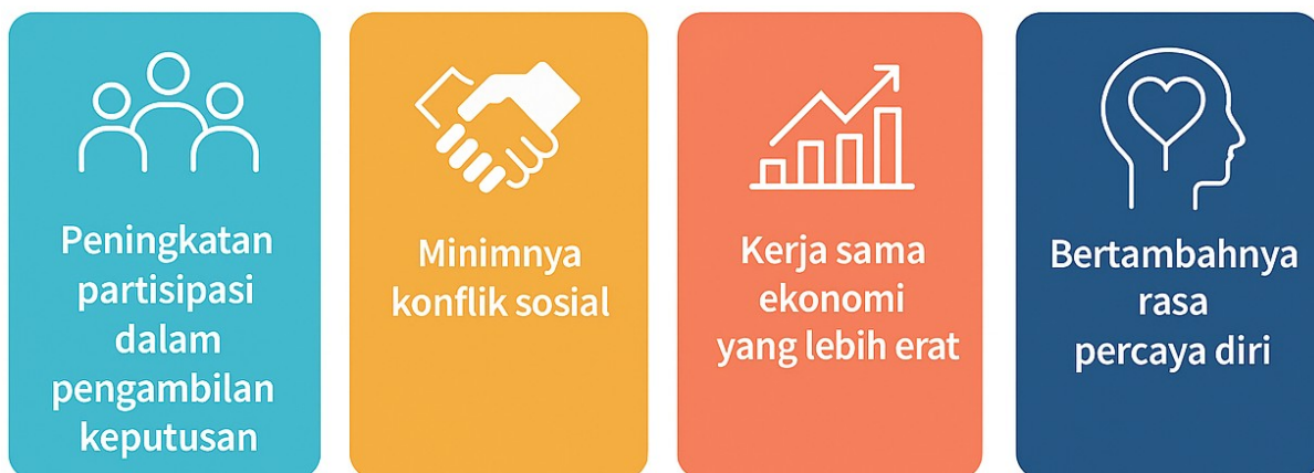
Gambar 2. Dampak Strategi Komunikasi

Dampak psikologis juga sangat terasa. Sebelum strategi komunikasi diterapkan, banyak transmigran yang merasa minder dan enggan berinteraksi dengan masyarakat lokal. Rasa rendah diri ini diperkuat oleh pengalaman konflik kecil dan stereotip negatif. Namun, setelah komunikasi dilakukan secara terbuka dan partisipatif, rasa percaya diri transmigran meningkat. Mereka merasa dihargai dan diakui sebagai bagian dari komunitas. Peningkatan rasa percaya diri ini mendorong mereka untuk lebih aktif dalam kegiatan sosial dan pembangunan desa. Secara tidak langsung, hal ini juga memperkuat integrasi sosial karena transmigran tidak lagi menarik diri dari interaksi.