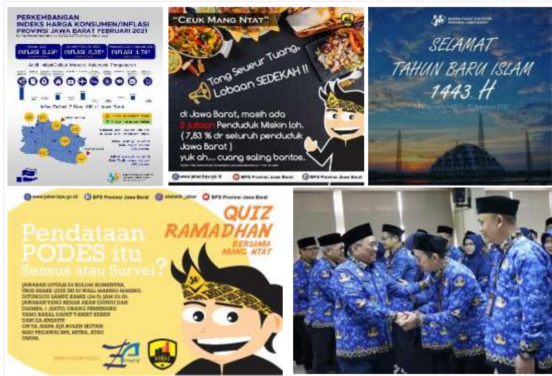
Gambar 4. Klasifikasi konten Facebook BPS Provinsi Jawa Barat

Terakhir, konten yang diposting dalam akun Facebook BPS Provinsi Jawa Barat adalah mengenai informasi lainnya. Informasi lainnya ini termasuk berbagai pengumuman atau ucapan selamat pada peringatan hari tertentu.