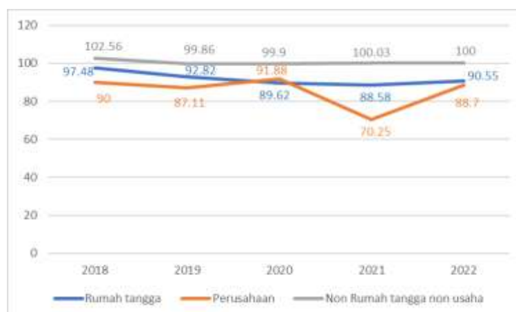
Gambar 2. Persentase response rate sensus dan survei BPS Provinsi Jawa Barat

Penolakan masyarakat yang terpilih menjadi responden menyebabkan rendahnya response rate dalam kegiatan sensus dan survei. Hal ini bisa diamati melalui persentase response rate kegiatan sensus dan survei BPS Provinsi Jawa Barat dalam lima tahun terakhir.