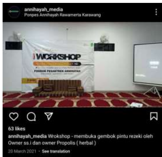
Gambar 4. Seminar Bedah Buku oleh PonPes Annihayah Media

Berdasarkan hasil observasi peneliti, tidak hanya sering menggelar acara di hari-hari besar perayaan islam, PonPes Annihayah juga pernah mengadakan seminar dan workshop . Topik seminar dan workshop masih berkaitan dengan ilmu keagamaan dan kerohanian. Dengan mengundang narasumber di bidang terkait, kegiatan seminar dilaksanakan dengan disiarkan melalui live streaming YouTube PonPes Annihayah dan poster iklan diunggah di media sosia Instagram @annihayah_media.