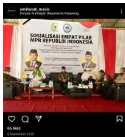
Gambar 3. Dokumentasi Hubungan Kerjasama PonPes Annihayah

PonPes Annihayah turut serta membantu mendukung kegiatan yang berhubungan dengan berbagai pihak, seperti terlihat dalam acara ”SOSIALISASI EMPAT PILAR MPR REPUBLIK INDONESIA” yang bekerjasama dengan Majelis Permusyawaratan Rakyat (MPR) dengan Yayasan Insan Nurul Fikri Indonesia pada tahun 2020 lalu.