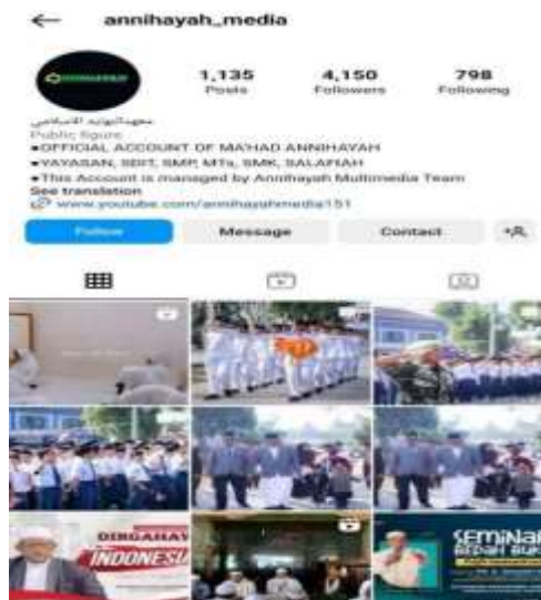
Gambar 1. Instagram Pondok Pesantren Annihayah

Pondok pesantren Annihayah menggunakan media sosial Instagram dalam memasarkan produknya. Instagram digunakan sebagai media informasi sekaligus media periklanan dengan menampilkan kegiatan maupun program-program yang dibuat oleh PonPes Annihayah. Media sosial Instagram ini mulai digunakan pada 1 Agustus 2016.