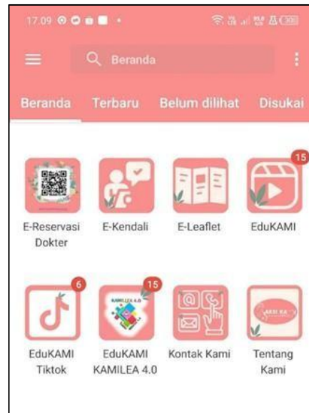
Gambar 2 Aplikasi “Aksi Kami”