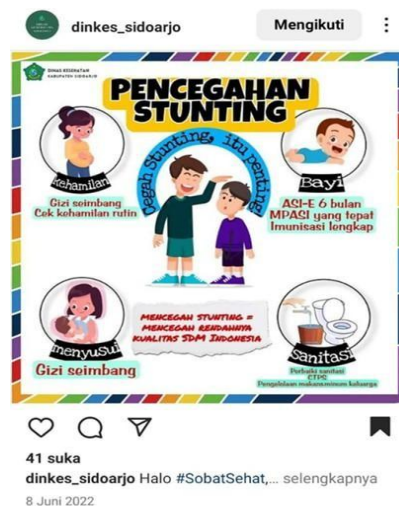
Gambar 4. Pesan dalam Sosialisasi pencegahan Stunting

penting”. Selain itu dilengkapi dengan cara mencegahnya yang diawali dari masa kehamilan agar menjaga gizi seimbang dan cek kehamilan rutin. Hal ini mengingat masih ditemukannya Ibu hamil yang KEK/Anemia dan ibu hamil yang tidak melakukan cek secara rutin. Pesan selanjutnya untuk bayi dengan pesan ASI-6 bulan, MPASI yang tepat dan imunisasi lengkap. Pesan tersebut disampaikan mengingat banyak bayi yang belum mendapatkan ASI eksklusif dan Pemberian MPASI yang belum sesuai dengan Pemberian Makan Bayi dan Anak (PMBA) karena berhubungan dengan Pola Asuh. Pesan komunikasi pencegahan stunting dapat dilihat pada Gambar 4.