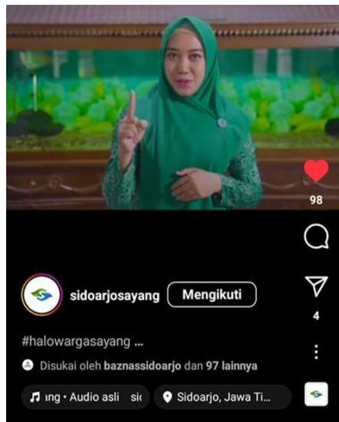
Gambar 5. Penggunaan Media Instagram dalam Sosialisasi stunting

kelompok konseling dan dukungan door to door.