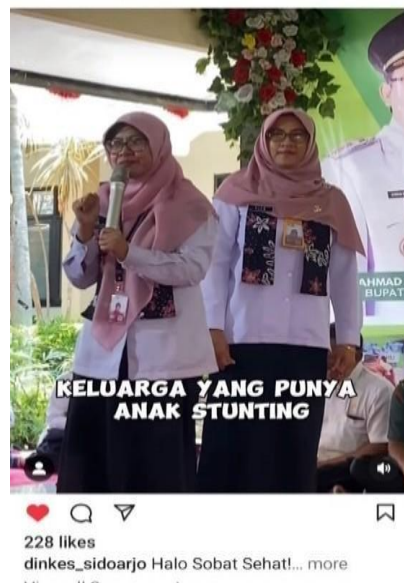
Gambar 3. Kepala Dinkes Kabupaten Sidoarjo menyampaikan pesan edukasi dan motivasi pada kader