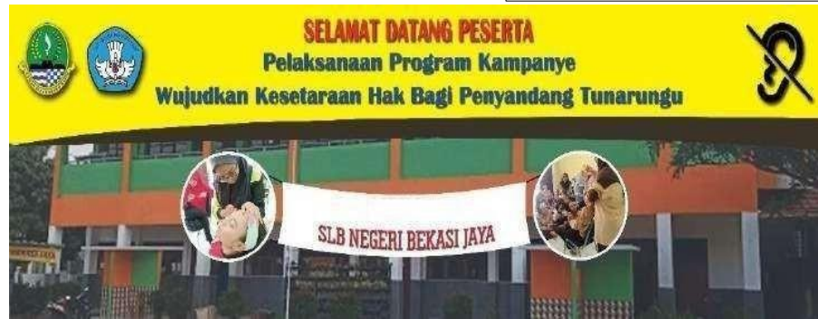
Gambar 2. Banner Program Kampanye

Pada media kampanye x-banner ukuran yang digunakan 60x160 cm, berisikan tentang pesan kampanye ditempatkan di sekitar area lokasi kampanye seperti halaman depan, koridor SLB Negeri Bekasi Jaya dan juga di area panggung. Pesan pada x-banner bertujuan sebagai pemberitahuan penting perihal pesan kampanye “memenuhi kesetaraan hak penyandang tunarungu” pada saat kampanye agar para masyarakat melihat pesan dari kampanye.