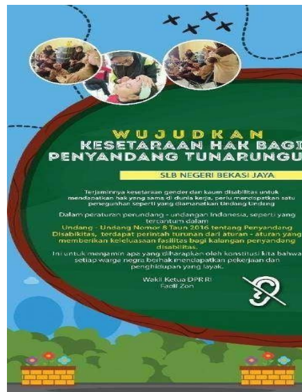
Gambar 3. X-Banner Program Kampanye

Pada media kampanye x-banner ukuran yang digunakan 60x160 cm, berisikan tentang pesan kampanye ditempatkan di sekitar area lokasi kampanye seperti halaman depan, koridor SLB Negeri Bekasi Jaya dan juga di area panggung. Pesan pada x-banner bertujuan sebagai pemberitahuan penting perihal pesan kampanye “memenuhi kesetaraan hak penyandang tunarungu” pada saat kampanye agar para masyarakat melihat pesan dari kampanye.