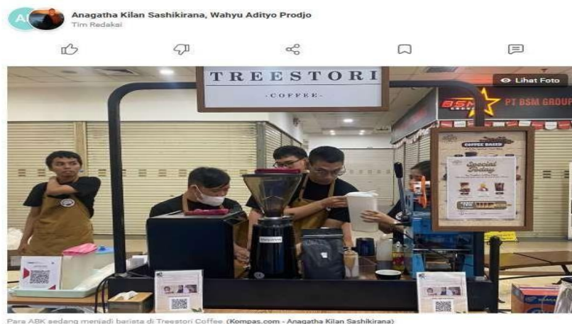
Para ABK sedang menjadi barista di Treestori Coffee