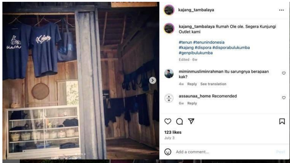
Gambar 3. Promosi Produk Oleh-oleh Kajang

Gambar di atas adalah produk cendramata yang tidak hanya dipajang di outlet Kawasan adat Kajang tetapi juga menjadi bagian dari promosi melalui media sosial. Olehnya menurut peneliti manajemen komunikasi yang dilakukan oleh pemuda adat kajang telah menempuh Langkah yang efektif dan memiliki dampak yang baik bagi prekonomian masyarakat Suku Kajang.