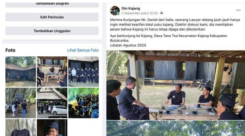
Gambar 2. Postingan Media Facebook

Dalam mempromosikan wisata adat Kajang, pemuda adat juga menerapkan teknik komunikasi persuasif yang efektif. Komunikasi persuasif adalah seni untuk meyakinkan orang lain agar menerima ide, pandangan, atau tindakan tertentu. Dalam konteks promosi wisata, teknik ini digunakan untuk menarik minat wisatawan agar mengunjungi dan mengalami langsung keunikan budaya Suku Kajang.