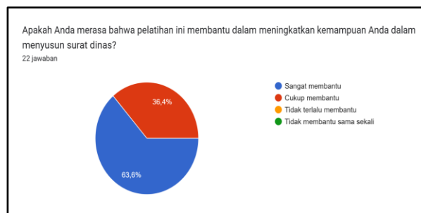
Gambar 2. Diagram Penilaian Peserta terhadap Pelatihan Penyusunan Surat Dinas

Manfaat pelatihan dirasakan sangat membantu oleh 63,6% peserta, sedangkan 36,4% menyatakan cukup membantu (Gambar 2). Adapun bagian yang dianggap paling sulit adalah penyusunan isi surat, sebagaimana diakui oleh 90,9% peserta, sementara sisanya menyebut kop surat (4,5%) dan penulisan alamat (4,5%) sebagai bagian tersulit (Gambar 3).