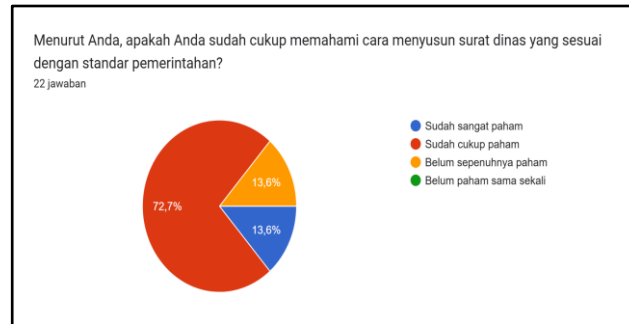
Gambar 1. Diagram tentang Pemahaman Cara Menyusun Surat Dinas

Manfaat pelatihan dirasakan sangat membantu oleh 63,6% peserta, sedangkan 36,4% menyatakan cukup membantu (Gambar 2). Adapun bagian yang dianggap paling sulit adalah penyusunan isi surat, sebagaimana diakui oleh 90,9% peserta, sementara sisanya menyebut kop surat (4,5%) dan penulisan alamat (4,5%) sebagai bagian tersulit (Gambar 3).