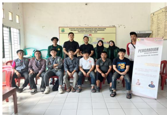
Gambar 9. Sesi Foto Bersama Peserta Pelatihan

Secara umum, terjadi peningkatan kualitas signifikan pada hasil akhir peserta, terutama dalam aspek framing dan pencahayaan. Beberapa peserta mulai menyadari pentingnya latar belakang netral dan pengaturan cahaya alami dalam mendukung kesan profesional pada foto produk. Namun demikian, beberapa peserta masih menghadapi tantangan teknis terkait ketajaman gambar dan pemanfaatan properti pendukung yang sesuai.