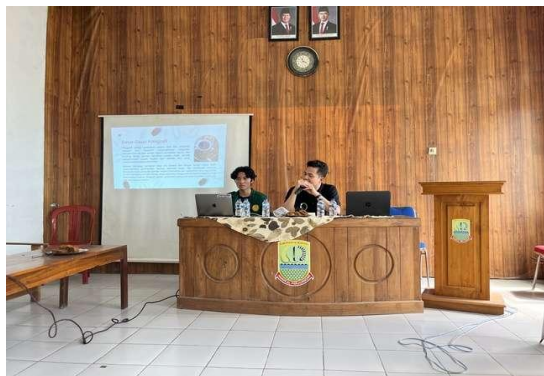
Gambar 5. Sesi Pemberian Materi

Pelatihan inti dilaksanakan di Balai Desa Medalsari dengan pengaturan ruangan yang memungkinkan demonstrasi langsung dan praktik. Pada sesi teori, peserta diajak memahami prinsip komposisi, seperti rule of thirds , leading lines , dan negative space . Pemahaman prinsip tersebut dilakukan melalui simulasi grid overlay dan analisis foto contoh. Materi pencahayaan alam dibawakan dengan demonstrasi pemanfaatan cahaya samping dan backlighting , serta penggunaan bahan diffuser sederhana, seperti karton fiber .