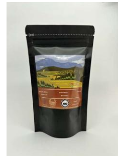
Gambar 8. Foto Produk Kopi setelah Pelatihan

Secara umum, terjadi peningkatan kualitas signifikan pada hasil akhir peserta, terutama dalam aspek framing dan pencahayaan. Beberapa peserta mulai menyadari pentingnya latar belakang netral dan pengaturan cahaya alami dalam mendukung kesan profesional pada foto produk. Namun demikian, beberapa peserta masih menghadapi tantangan teknis terkait ketajaman gambar dan pemanfaatan properti pendukung yang sesuai.