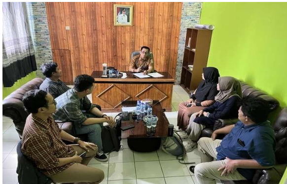
Gambar 2. Proses Perizinan dengan Kepala Desa

Proses perizinan dan observasi dimulai pada bulan Februari tahun 2025, ketika tim pengabdian melakukan pertemuan koordinasi dengan Aparat Desa Medalsari. Ketua tim bersama sekretaris dan kepala desa bertukar pikiran di kantor desa mengenai mekanisme pendataan pelaku UMKM kopi dan dukungan sarana prasarana yang diperlukan, seperti aula, kursi, dan layar proyektor. Setelah kesepakatan logistik, tim mengadakan observasi mengenai keadaan mengenai kemahiran fotografi produk di Balai Desa. Dalam sesi ini, para pelaku kopi diminta untuk memperlihatkan foto produknya masing-masing. Dari hasil observasi, teridentifikasi bahwa sebagian besar foto produk belum memiliki kualitas yang baik. Hasil observasi tersebut menjadi acuan yang menunjukkan bahwa terdapat masalah mengenai foto produk kopi.