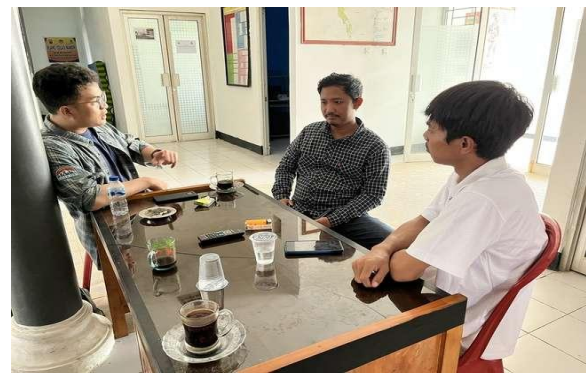
Gambar 3. Diskusi Bersama Pelaku Kopi