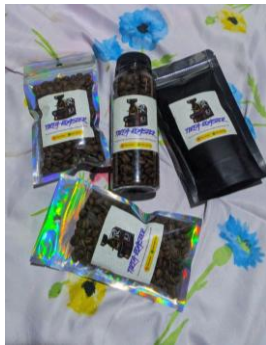
Gambar 7. Foto Produk Kopi sebelum Pelatihan

Evaluasi dilakukan dengan membandingkan foto produk awal yang diambil sebelum pelatihan dengan foto hasil praktik setelah sesi pelatihan. Aspek evaluasi meliputi ketepatan komposisi, pencahayaan, fokus objek, serta kemampuan visual dalam menyampaikan pesan produk. Penilaian dilakukan secara terbuka melalui diskusi bersama peserta. Masing-masing foto ditampilkan dan diberi komentar konstruktif oleh tim dan peserta lain.