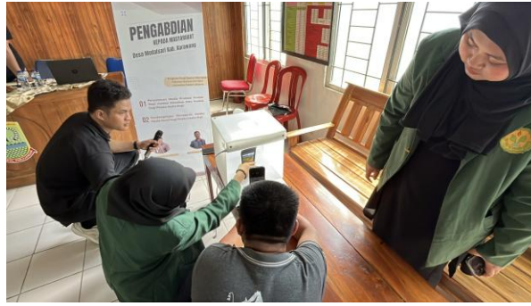
Gambar 6. Sesi Demonstrasi dan Praktik