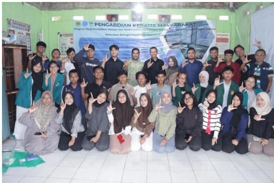
Gambar 1. Sesi Foto Bersama

Sesi materi mulanya diawali dengan pengenalan teknik membaca puisi secara ekspresif, hal tersebut meliputi artikulasi dan intonasi, penekanan kata dan jeda, ekspresi wajah dan gerak tubuh, dan pemahaman makna dan emosi dalam puisi. Pada kegiatan ini, peserta tidak hanya membacakan puisi karya sastrawan ternama, tetapi juga menulis puisi singkat karya sendiri. Puisi-puisi tersebut selanjutnya diolah menjadi konten digital berupa video pembacaan puisi dan rekaman suara pembacaan puisi. Proses perekaman dilakukan menggunakan perangkat sederhana seperti telepon pintar dan tripod, kemudian diedit menggunakan aplikasi pengeditan ringan seperti CapCut. Peserta belajar mengatur pencahayaan, sudut pengambilan gambar, latar visual, serta penambahan teks dan musik pendukung agar konten lebih menarik.