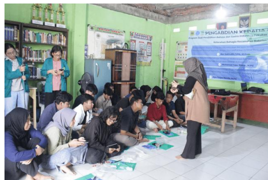
Gambar 2. Sesi Materi dan Praktik