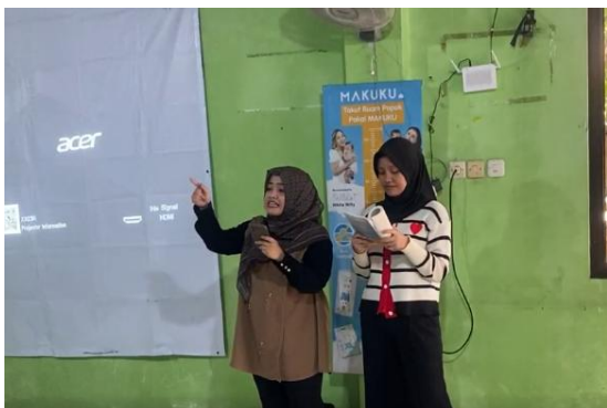
Gambar 3. Peserta Membacakan Puisi