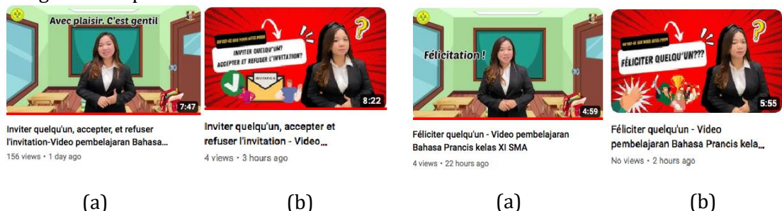
Gambar 4. 1 Perbedaan tampilan thumbnail pada video 1&2 , (a) merupakan tampilan media sebelum diperbaiki, (b) merupakan tampilan media setelah diperbaiki.