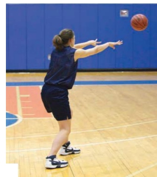
Gambar 2. Passing

rekan satu tim. Menurut Kosasih (2008: 26), “ Passing yang akurat adalah salah satu kunci keberhasilan serangan sebuah tim dan merupakan unsur penentu tembakan-tembakan yang berpeluang besar mencetak angka”. Krause et al (2008: 41)., menambahkan, “ In coaching, good passing tends to take the pressure off a team’s defensive play and break down the opponent’s defense. Because passing is the quickest way to move the ball and challenge the defense, it should be the primary weapon of offensive attack, thus applying the priority principle of balance and quickness ”.