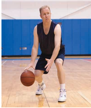
Gambar 1. Dribble

yang pertama diperkenalkan kepada pemula, karena keterampilan ini sangat penting bagi setiap pemain yang terlibat dalam pertandingan bola basket”.