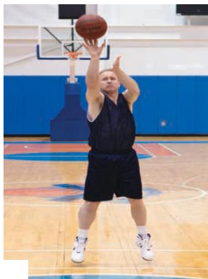
Gambar 3. Shooting

Shooting pada hakikatnya merupakan keterampilan utama dalam olahraga bola basket. Teknik shooting merupakan skill untuk memasukkan bola ke dalam keranjang basket. Menurut Showalter (2012:70), “ Most players love the chance to put the basketball through the hoop and will be highly motivated to learn proper shooting technique ”. Lalu Rose (2013:71), “ Shooting should be an integral part of every offensive drill ”.