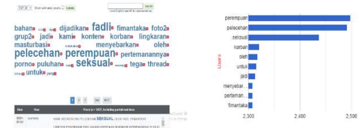
Gambar 2. Hasil Analisis Text “Pelecehan Perempuan Online”

Juli 2021) untuk melihat pola komunikasi terhadap suatu isu dan bagaimana jejaring komunikasi tersebut menyebar dan melahirkan apa yang disebut sebagai stigma dan apa yang disebut sebagai awareness . Dalam tulisan ini dikotomi tersebut dijelaskan oleh stigma yang membuat orang abai, namun disisi lain membangun kesadaran sosial dalam melihat persoalan kekerasan terhadap perempuan. Metode analisis menggunakan social network analysis dengan Netlytic sebagai platform yang membantu melakukan pemrosesan data. Data yang digunakan sebanyak 2500 data dari Twitter dengan kata kunci “Pelecehan seksual Online”.