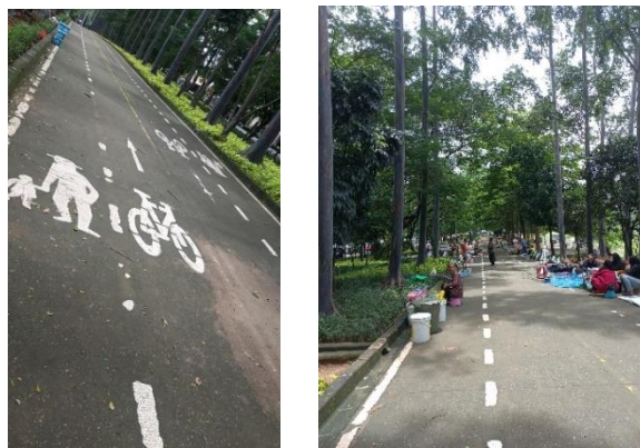
Gambar 3. Jogging Track dan Taman BKT

Wilayah BKT dibuat indah dengan adanya penghijauan melalui metode penanaman tumbuhan pada tanah kosong sehingga wilayah ini menjadi sehat, asri, dan sejuk.