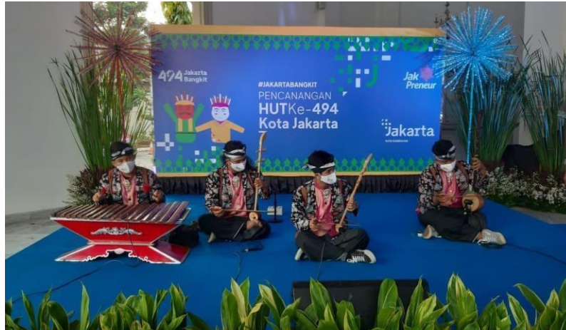
Gambar 1. Pemain Gambang Kromong

orang Cina di kawasan Pasar Senen yang bernama Teng Tjoe, melengkapi musik Gambang Kromong dengan instrumen kromong, gendang, kempul dan gong. Selain itu, dibawakan pula lagu Sunda populer dalam sajiannya.