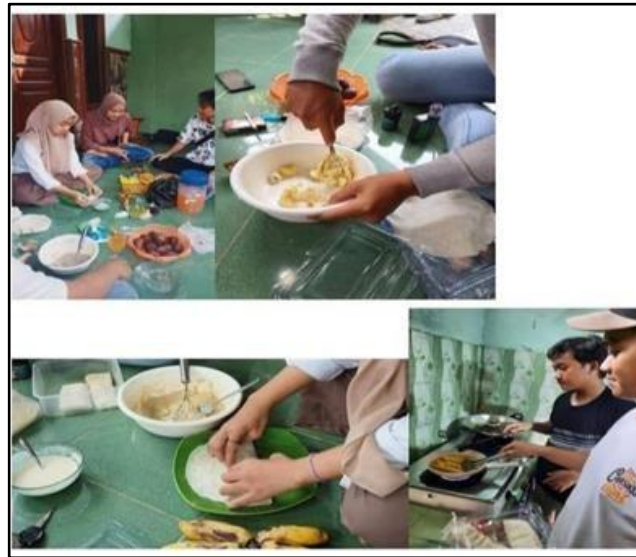
Gambar 3. Kegiatan Mahasiswa Universitas Indraprasta Dalam Melaksanakan Tugas Kewirausahaan