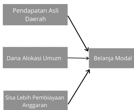
Gambar 1. Kerangka Teoritik