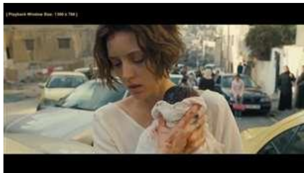
Gambar 10. Scene pada durasi 01.16.00 dalam film Inch'Allah