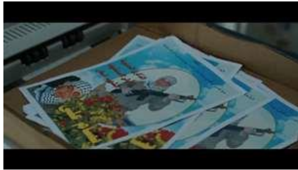
Gambar 4: Scene pada durasi 10.09 dalam film Inch'Allah