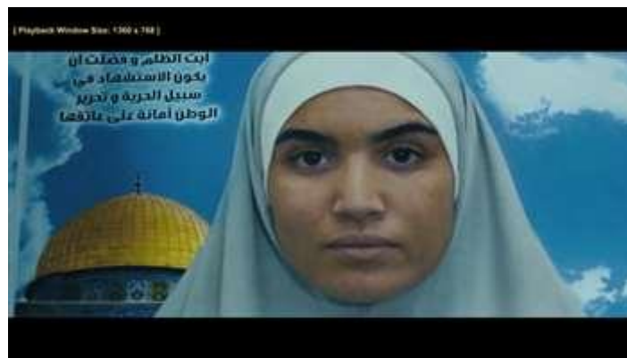
Gambar 11. Scene pada durasi 01.33.00 dalam film Inch'Allah