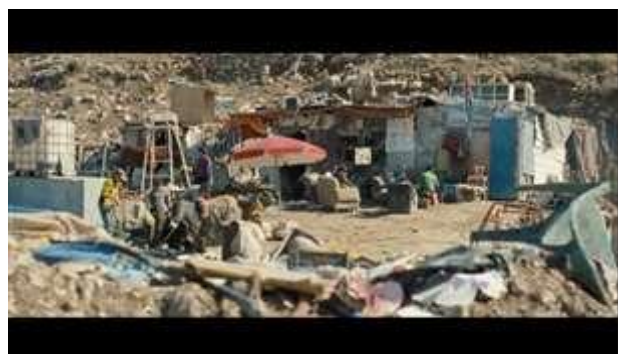
Gambar 5. Scene pada durasi 11.22 dalam film Inch'Allah