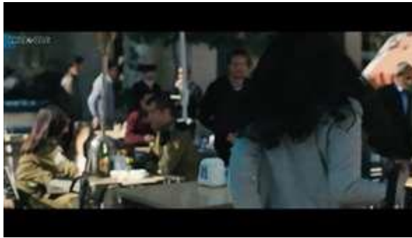
Gambar 2. Scene pada durasi 01.46 dalam film Inch'Allah