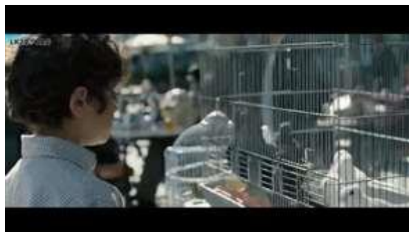
Gambar 3. Scene pada durasi 02.04 dalam film Inch'Allah