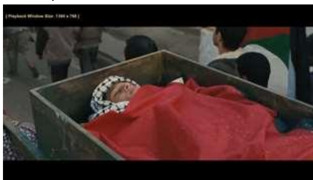
Gambar 7. Scene pada durasi 31.47 dalam film Inch'Allah