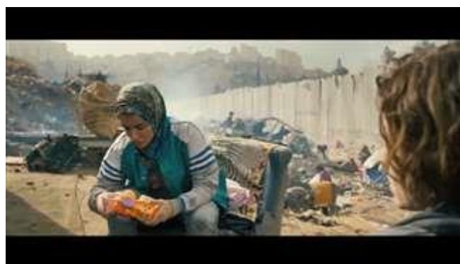
Gambar 8. Scene pada durasi 38.22 dalam film Inch'Allah