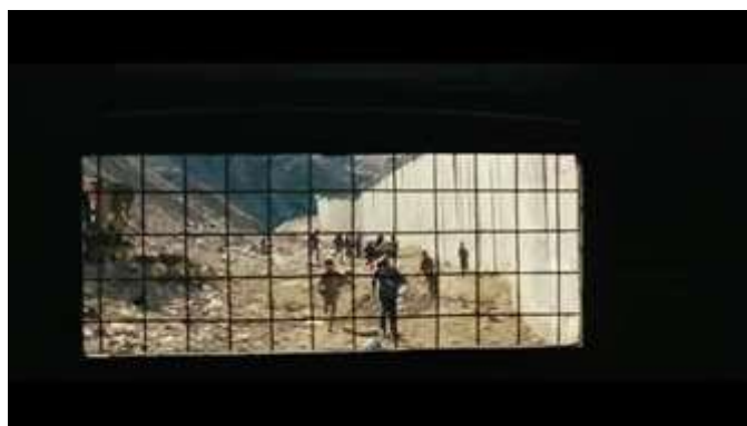
Gambar 6. Scene pada durasi 30.06 dalam film Inch'Allah