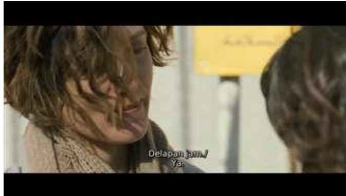
Gambar 9. Scene pada durasi 01.00.33 dalam film Inch'Allah