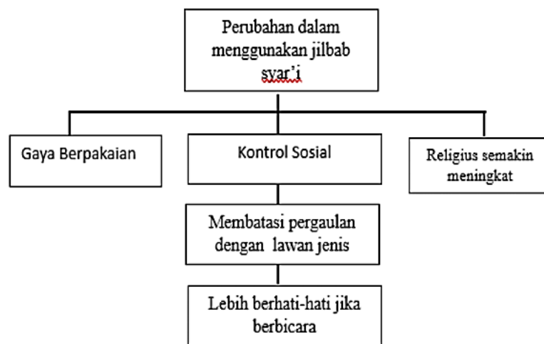
Skema 3. Perubahan Setelah Menggunakan Jilbab Syar'i

Kontrol sosial hal ini meliputi perubahan interaksi dan pergaulan dengan lawan jenis yang semula bergaul dengan intens sekarang lebih membatasi diri lalu lebih berhati-hati ketika berbicara seperti menjaga perkataan agar tidak bicara kasar. Ketiga, religiusitas semakin meningkat yaitu setelah menggunakan jilbab syar'i lebih rajin ibadah.