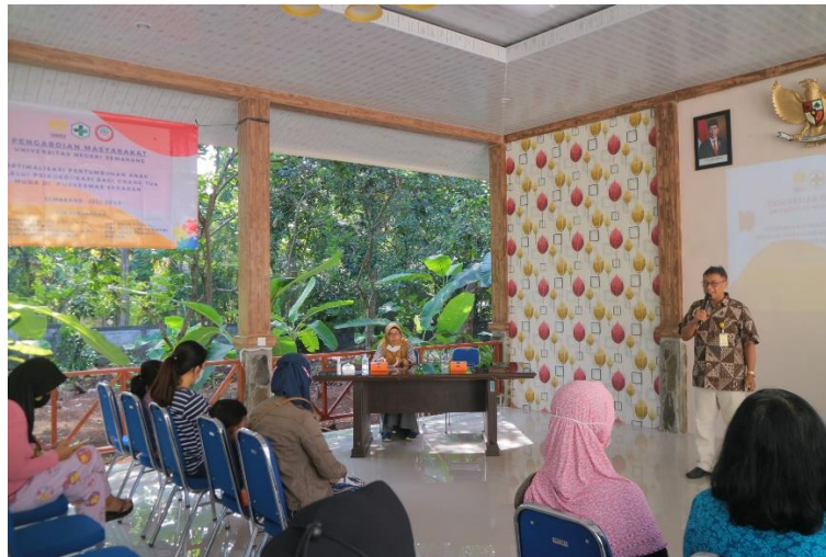
Gambar 1. Sambutan Dekan FIPP Universitas Negeri Semarang

Kegiatan dilaksanakan di Puskesmas Sekaran yang diawali dengan sambutan oleh Dekan Fakultas Ilmu Pendidikan dan Psikologi Universitas Negeri Semarang dan perwakilan dari Puskesmas Sekaran yaitu salah satu dokter di tempat tersebut. Sebelum penyampaian materi, mahasiswa yang berperan sebagai fasilitator kegiatan membagikan lembar pre-test sebagai lembar asesmen pada peserta. Setelah lembar pre-test dikumpulkan kembali, dimulailah penyampaian materi.