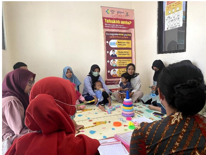
Gambar 2. Follow Up Kegiatan Pengabdian Day-1

Setelah dilaksanakan psikoedukasi, dilaksanakan juga kelas parenting yang dilaksanakan di Daycare Rumah Keluarga Sekar Kasih binaan Puskesmas Sekaran. Kegiatan ini dilakukan untuk follow up kepada para orang tua muda setelah kegiatan psikoedukasi.