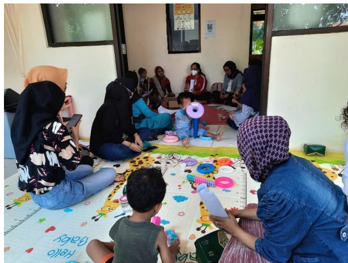
Gambar 3. Follow Up Kegiatan Pengabdian Day-2