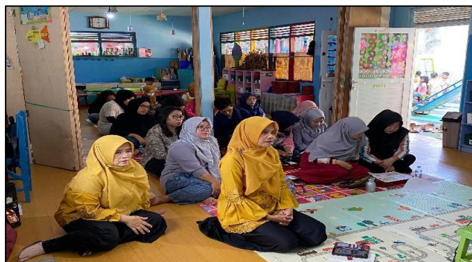
Gambar 2. Pembukaan Sesi Seminar