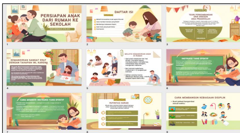
Gambar 1. Materi Persiapan Anak dari Rumah ke Sekolah

Untuk mencapai tujuan meningkatkan pemahaman orang tua tentang psikologi perkembangan anak usia dini, memberikan panduan praktis menumbuhkan kemandirian dan kedisiplinan anak, serta mengembangkan media edukatif berbasis visual seperti jadwal bergambar, yaitu memberikan seminar parenting . Seminar parenting akan menjelaskan bagaimana cara membangun kemandirian anak usia dini dirumah, apa peran rutinitas dan penguatan dalam membentuk perilaku anak serta bagaimana strategi memberikan instruksi yang efektif dan ramah anak. Berikut adalah materi seminar parenting yang dapat dilihat melalui gambar 1.