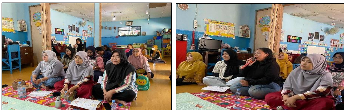
Gambar 4. Sesi Diskusi dan Tanya Jawab