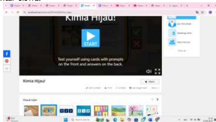
Gambar 2. Tampilan Media Wordwall

Hasil ini menemukan media Wordwall sebagai alat bantu pembelajaran di kelas eksperimen membantu siswa belajar lebih baik daripada di kelas kontrol. Ada beberapa alasan untuk hal ini. Salah satunya adalah seberapa banyak siswa terlibat. Alat bantu Wordwall membuat materi pembelajaran menarik dan menyenangkan, yang membuat siswa lebih fokus dan bersemangat dalam belajar (Rahmastuti dkk., 2024). Sementara itu, media PPT sering kali membuat siswa merasa bosan karena terlalu banyak digunakan dalam pembelajaran dan kurang membuat proses belajar mengajar aktif (Thoyyibah dkk., 2024). Hal ini didukung hasil penelitian menurut Nadia dan Desyandri (2022) menyatakan bahwa penggunaan media pembelajaran Wordwall di kelompok eksperimen menunjukkan perbedaan dibandingkan dengan kelas kontrol. Siswa lebih terlibat dalam pembelajaran, dan terjadi lebih banyak interaksi antara siswa, guru, dan antar siswa.