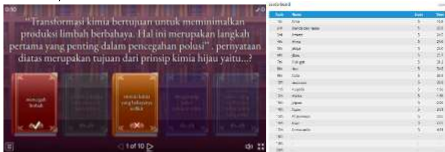
Gambar 4. Tampilan penilaian otomatis media wordwall

untuk penilaian (kuis atau pretest dan posttest) tanpa perlu penilaian manual oleh guru (Nurpeni dkk., 2024).