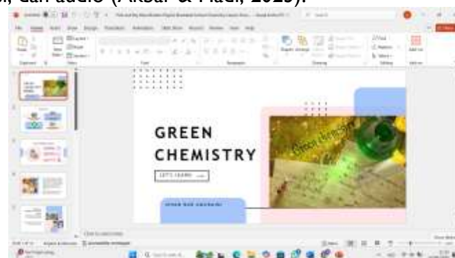
Gambar 3. Tampilan Media Powerpoint

Faktor kedua adalah tampilan Wordwall yang lebih menarik dan interaktif dibandingkan presentasi PPT yang ditunjukkan pada Gambar 2 dan 3. Wordwall tidak mengharuskan Anda memulai dari awal atau membuat desain tambahan. Oleh karena itu, Wordwall sudah memiliki fitur bawaan, animasi, dan audio (Akbar & Hadi, 2023).