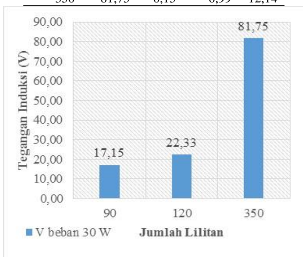
Gambar 3. Perbandingan Tegangan Induksi Terukur dalam kondisi Berbeban 30 W

Berdasarkan tabel 2. dan gambar 3, tegangan induksi berbeban 30 W dengan jumlah lilitan 90, 120, dan 350 berturut-turut ialah sebesar 17,15 volt, 22,33 volt, dan 81,75 volt. Pada gambar 4.3. dapat terlihat adanya peningkatan besarnya tegangan berdasarkan variasi jumlah lilitan kumparan stator. Hal tersebut membuktikan bahwa adanya pengaruh jumlah lilitan kumparan stator terhadap tegangan induksi generator