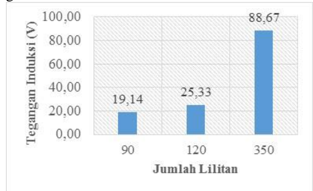
Gambar 1. Perbandingan Tegangan Induksi Terukur

Pengujian tanpa beban dilakukan pada setiap variasi sampel. Perbandingan tegangan induksi terukur antara variasi sampel ditunjukkan pada gambar 1.