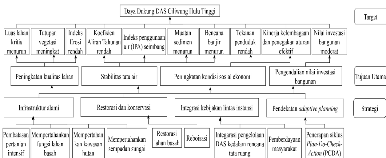
Gambar 3 Pohon Tujuan DAS Ciliwung Hulu

peningkatan kondisi sosial ekonomi; dan (4) pengendalian nilai investasi bangunan. Pendekatan ini menegaskan bahwa perbaikan daya dukung DAS harus dilakukan secara sistemik dan terintegrasi, bukan melalui intervensi sektoral yang terpisah.