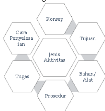
Gambar 3. Komponen desain aktivitas pembelajaran

pembelajaran. Adapun model desain aktivitas tersebut tergambar dalam gambar 3.