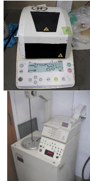
Gambar 2. (a) Moisture Meter dan (b) Bomb Calorimeter

dengan Shimadzu Auto- Calculating Bomb Calorimeter CA-4AJ, Gambar 2(b).