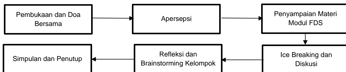
Gambar 3. Rangkaian Pembelajaran di dalam FDS

FDS dilaksanakan dengan menjunjung prinsip kesetaraan dan inklusifitas, karena pada dasarnya orang dewasa atau dalam hal ini KPM PKH juga tidak ingin diperlakukan seperti anak-anak. Peran dari seorang fasilitator FDS begitu penting dalam mewujudkan tujuan inti FDS, sehingga upaya pemberian pelatihan kepada fasilitator dan monev juga krusial untuk secara konsisten dilaksanakan (Aguslida et al., 2021). Berikut adalah tahapan yang harus dilakukan dalam setiap kegiatan FDS: