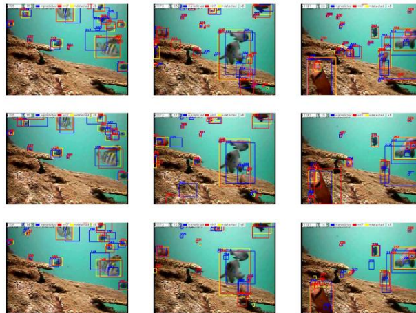
GAMBAR 2. Sampel Frame Hasil Keluaran Tracking

Pada tahap ini, masing-masing video diuji performa tracking serta counting -nya. Diambil data uji setiap 10 frame sekali selama video berlangsung. Kemudian dihitung RMSE koordinat piksel objek ( x, y ) dari seluruh data uji untuk masing-masing kategori pengujian. Secara garis besar, hasil yang diharapkan adalah nilai RMSE yang kecil dimana nilai 0 menandakan model yang akurat. Selain itu dihitung juga jumlah objek rata-rata seluruh data uji hasil dari prediksi KF.