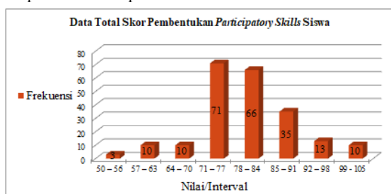
Gambar 2. Data Total Skor Pembentukan Participatory Skills Siswa

Pada tabel 2 distribusi frekuensi variabel pembentukan participatory skills siswa diatas, bahwa frekuensi tertinggi berada pada nilai atau interval 71 - 77 dengan frekuensi sebesar 71 responden dan presentase sebesar 32%, sedangkan frekuensi terendah berada pada nilai atau interval 50 - 56 dengan frekuensi 3 responden dan presentase sebesar 1%.