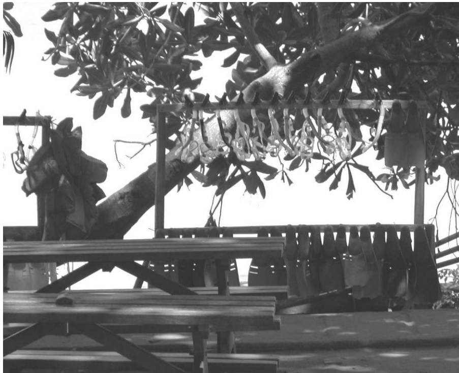
Foto 1. Salah satu tempat penyewaan alat-alat diving dan snorkling .

menambah profesi menjadi usaha penyewaan perahu, penyewaan alat-alat selam ( snorkling ), pemandu diving (penyelaman), penjualan souvenir, pembuatan kerajinan dari kerang dan bambu, dan sebagainya. Terdapat pula pembagian lahan usaha antara pria dan wanita. Kaum pria berusaha di bidang penyewaan perahu dan peralatan selam, sedangkan kaum wanita berusaha di bidang penjualan hasil kerajinan dan souvenir.