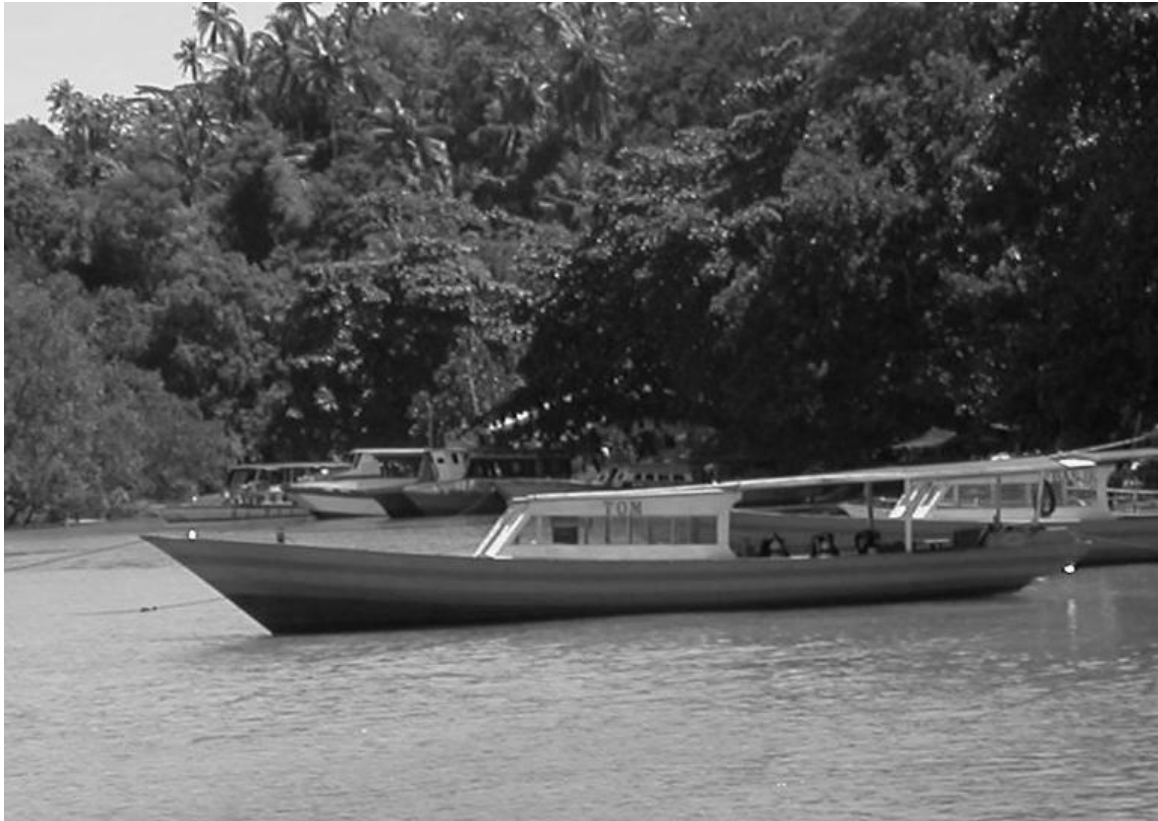
Foto 2. Perahu longboat milik masyarakat yang disewakan kepada wisatawan.

Hal ini menyebabkan penjual jasa persewaan alat snorkling tidak memperoleh pelanggan wisatawan yang ingin menyewa peralatan selamnya.