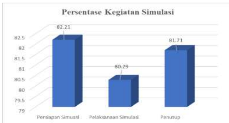
Gambar 2. Grafik Persentase Kegiatan Simulasi

Hal ini menunjukkan bahwa dalam melakukan simulasi RPP yang telah mereka buat, sudah dapat dikatakan konsisten dengan apa yang telah mereka rancang. Hasil ini sudah menggembirakan. Dan diharapkan pada saat mereka sudah menunaikan keprofesiannya calon guru