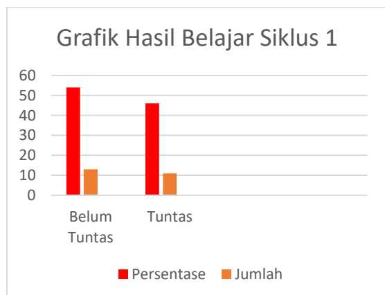
Gambar 2. Diagram Ketuntasan Hasil Belajar Siswa Siklus I

Terjadinya peningkatan hasil belajar disebabkan oleh peserta didik semakin nyaman dalam melaksanakan pembelajaran berdifferensiasi jika dibandingkan dengan pembelajaran konvensional, karena pembelajaran dilaksanakan sesuai dengan kebutuhan peserta didik tersebut. Juga disebabkan oleh kondisi pembelajaran berdifferensiasi menekankan pembelajaran yang sudah direncanakan bersama-sama, dengan demikian peserta didik semakin bersemangat dalam belajar