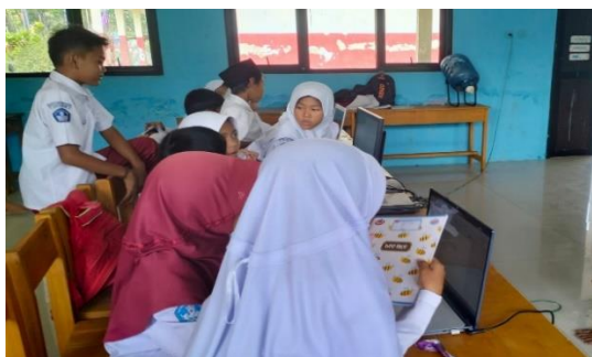
Gambar 5. Penggunaan Teknologi Dalam Pembelajaran

Pembalajaran TPACK ini berdampak besar pada kehidupan peserta didik. peserta didik mampu beradaptasi dengan berbagai macam teknologi sesuai dengan keadaan zaman yang terus berkembang. Hak tersebut juga dapat dijadikan sarana dalam perkembangan keterampilan peserta didik dalam teknologi. Sejalan dengan pernyataan diatas menurut Stevanus (2021:103), adapun manfaat pembelajaran TPACK bagi pendidik dan peserta didik diantaranya: Meningkatkan pemahaman siswa melalui keterlibatan teknologi, Meningkatkan keterampilan guru dalam mengolaborasikan teknologi dalam pembelajaran, Peserta didik mendapatkan tantangan baru dalam proses belajarnya, Konten pembelajaran yang rumit bisa disederhanakan dengan bantuan teknologi, Bisa membantu guru dalam mencapai tujuan pengembangan kompetensi.