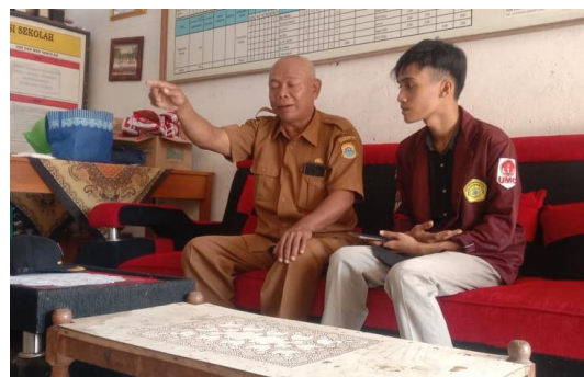
Gambar 4. Kegiatan wawancara Dengan Kepala Sekolah

Kebijakan kepala sekolah juga berlaku bahwa kegiatan pembelajaran berteknologi guru diwajibkan memiliki keterampilan dan pengalaman untuk mengoperasikan perangkat pembelajarannya. Karena tidak mudah untuk memahami perangkat yang akan digunakan beserta cara menuangkan pedagogik di dalamnya. Guru pun dituntut untuk menguasai keterampilan ini karena kebutuhan untuk memenuhi kompetensi keprofesionalan sebagai profesi pendidik. Salah satunya adalah mempersiapkan perangkat pembelajaran berteknologi yang dimana guru melakukan persiapan pembelajaran terhadap perangkat yang akan digunakannya.