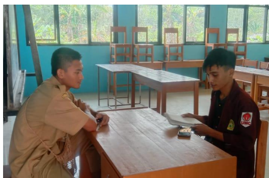
Gambar 3. Kegiatan Wawancara Dengan Guru Kelas V

Dalam pelaksanaan kegiatan pembelajaran tentu tak terlepas dari segala hambatan dan upaya yang harus dilakukan. Kegiatan pembelajaran dengan mengimplementasikan teknologi didalamnya sudah menjadi hal yang lumrah dan memang sudah seharusnya saat ini pembelajaran yang berbasis pada teknologi melihat dan menyerap dengan keadaan zaman saat ini. Sesuai dengan hasil wawancara yang dilakukan dengan narasumber bahwa pelaksanaan dengan berbasis TPACK ini yang dilakukan oleh beliau tentu dengan diawali dengan segala persiapan pembelajaran yang akan dilakukan. Proses pembelajaran yang dilakukan dengan berbasis TPACK ini menjadi tantangan besar bagi narasumber dalam pelaksanaannya di sekolah tersebut.