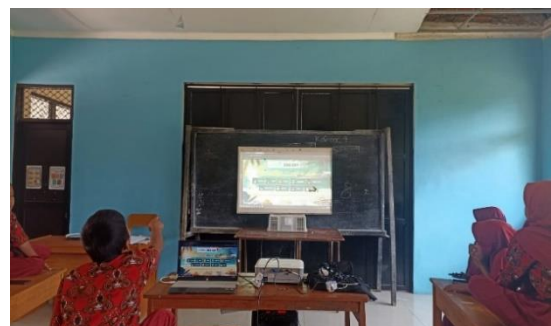
Gambar 2. Kegiatan Pembelajaran

Menurut Schmidt et al. , (2019: 125), TPACK dipilih sebagai kerangka acuan berdasarkan AACTE Committee on Innovation and Technology , karena berfokus mendesain dan mengevaluasi pengetahuan Pendidik dalam mengintegrasikan teknologi, pengetahuan, dan pembelajaran yang efektif. Hal ini membuat standar pendidikan yang mengacu kepada framework TPACK akan menjadi lebih tinggi karena pembelajaran yang diterapkan adalah hasil dari integrasi penggunaan teknologi, kemampuan pedagogi, dan pengetahuan konten ajar. Teori ini menunjukkan bahwa pembelajaran TPACK merupakan cara belajar dan mengajar yang manusiawi karena mencerminkan keseimbangan yang menekankan kepada pengetahuan pendidik yang diaplikasikan menjawab dari kebutuhan peserta didik. Peserta didik belajar karena mereka perlu belajar. Pembelajaran yang ideal harus memenuhi kebutuhan peserta didik tersebut.