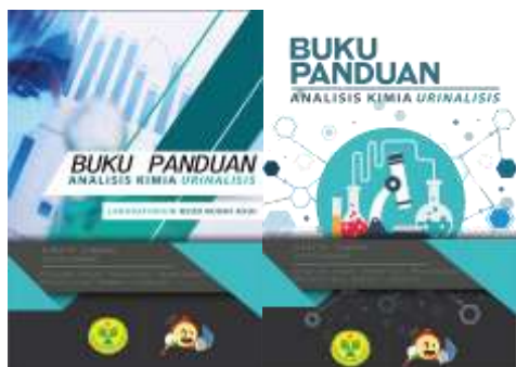
Gambar 4. Contoh cover yang belum dan sesudah disunting

menyesuaikan masukan dari para ahli materi maupun media. Seperti berikut: