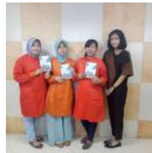
Gambar 6. Peneliti bersama mahasiswa setelah melakukan uji coba one-to-one .