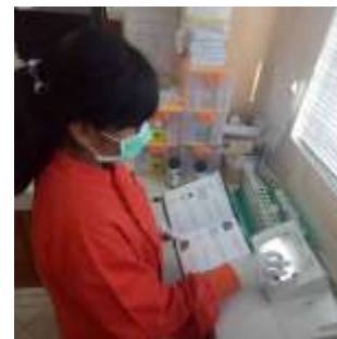
Gambar 7. Penggunaan Buku Panduan pada tahap uji coba lapangan.