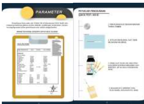
Gambar 2. Contoh terkait dalam isi buku panduan

Find Example (Menentukan Contoh Terkait). Hasil dari peneliti mempelajari materi secara singkat dan melakukan diskusi bersama ahli materi adalah, peneliti memutuskan untuk menggunakan contoh terkait dengan menyesuaikan mahasiswa. Hal tersebut dilakukan guna mempermudah dalam memahami informasi yang, bersifat abstrak dan sulit untuk dipahami. Sebagai berikut :