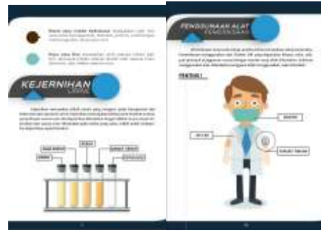
Gambar 3. Gambar grafis dalam isi buku panduan

Think Graphic (Menentukan Grafis). Setelah menganalisis dan menyesuaikan dengan karakteristik mahasiswa, peneliti menghasilkan beberapa grafis yang akan digunakan pada isi buku panduan. Seperti berikut: