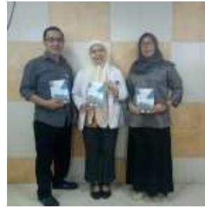
Gambar 5. Para ahli materi setelah melakukan ujicoba dan salah satu dokter spesialis di laboratorium.

Adapun beberapa dokumentasi berupa foto, pada saat dilakukannya pada tahap ujicoba, sebagai berikut :