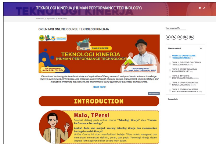
Gambar 1. Contoh tampilan produk MOOC bagian orientasi online course

Pada tahap pengembangan, learning objects didesain dan dikembangkan berdasarkan Rencana Pembelajaran Semester (RPS) dan hasil analisis kebutuhan, dengan penekanan pada visualisasi komunikatif dan kompatibilitas lintas perangkat. Pengembangan konten mempertimbangkan prinsip Cognitive Load Theory (Sweller, 1988), yaitu menyajikan informasi dalam unit-unit kecil ( chunking ) untuk mengurangi beban kognitif. Produk dirancang agar kompatibel lintas perangkat dan efisien dalam akses, sesuai dengan rekomendasi Watted & Barak (2018) terkait pentingnya responsivitas dan kecepatan akses dalam pengalaman pengguna MOOC.