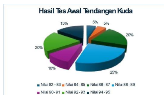
Gambar 1. Diagram Pie Hasil Tes Awal Tendangan Kuda

Pada penelitian kali ini diawali dengan pengambilan data siswa ekstrakurikuler SMA Negeri 8 Bogor dan diadakan tes awal pada tanggal 4 Juni 2024. Pelaksanaan kegiatan tes awal dilakukan peneliti kepada siswa SMA Negeri 8 Bogor yang berjumlah 20 orang, 10 orang siswa putra dan 10 siswa orang putri. Kegiatan tes awal ini guna untuk mengidentifikasi kondisi awal kemampuan siswa terhadap latihan khususnya untuk teknik tendangan kuda melalui media sabuk. Hasil tes awal menunjukkan bahwa, 20 siswa yang mengikuti tes awal, belum ada siswa yang mampu mencapai nilai maksimal dan dinyatakan belum berhasil, karena mendapatkan nilai kurang dari 100 dengan rata – rata nilai 89,5. Setelah dilakukan tes awal hasil tes awal adalah sebagai berikut: nilai terendah 82 dan nilai tertinggi 95. Hasil tes siswa ekstrakurikuler SMA Negeri 8 Bogor dapat dilihat dalam grafik di bawah ini :