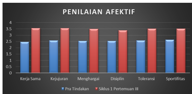
Gambar 3. Hasil Afektif

Berdasarkan hasil observasi pada siklus I pertemuan ketiga, diperoleh temuan bahwa terdapat peningkatan kemampuan 7 teknik passing futsal pada siswa kelas V SDN Menteng 02 Pagi melalui penerapan model pembelajaran Cooperative Learning tipe (Teams Games Tournament). Peneliti juga menemukan peningkatan mencakup aspek lainnya yaitu afektif melalui praktik langsung yang dilakukan selama pembelajaran. Hal ini terlihat melalui gambar peningkatan afektif sebagai berikut :