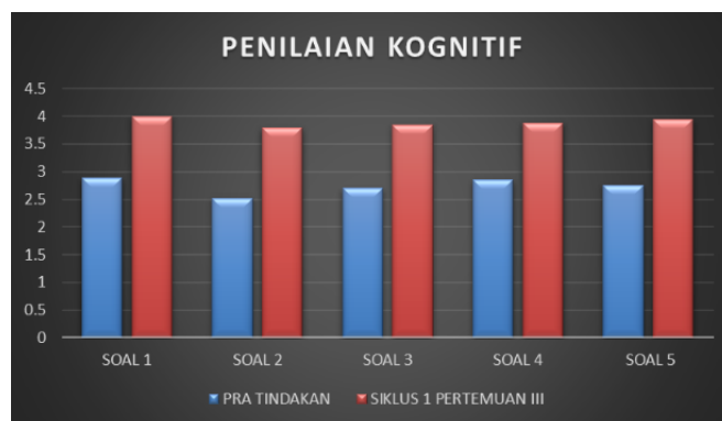
Gambar 2. Hasil Kognitif

Seperti yang ditampilkan dalam gambar di atas, adanya peningkatan yang terjadi pada aspek kognitif atau pengetahuan. Pada aspek kognitif yang semula 44,1% berkategori kurang dan 55,9 berkategori cukup, menjadi 97,6% kategori sangat baik dan 2,94% kategori baik, hal ini dapat memperkuat bahwa media permainan dapat meningkatkan keseluruhan aspek dari hasil belajar