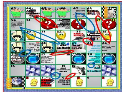
Figure 2. ISO Board

Penggunaan media ISO dalam proses pembelajaran adalah memperjelas penyajian pesan agar tidak terlalu verbal (berupa kata-kata tertulis atau lisan belaka). Kelebihan media ISO antara lain mampu mengatasi keterbatasan ruang belajar karena belajar bisa dimana saja, mampu mengaktifkan indera dengan tujuan melatih hand on and mind on, mengatasi sikap pasif siswa akibat belajar sambil bermain dan mampu untuk menggambarkan stimulus dan pengalaman belajar bagaimana NASA melakukan misinya ke bulan. Dengan demikian, media pembelajaran ISO dapat digunakan sebagai saluran komunikasi antara guru dan siswa sehingga tujuan pengajaran tercapai. Kelemahan media ISO antara lain keterampilan yang dibutuhkan dalam pembuatan media ini. Selain itu, siswa kesulitan menjalankan media ini jika belum membaca panduan permainan ISO karena media ini merupakan modifikasi dari ular tangga. Dadu pintar adalah dadu berbentuk kubus dan ada satuan ukuran di setiap permukaannya, seperti yang ditunjukkan pada Gambar 5. Dadu biasa memiliki angka atau titik di permukaannya. Satuan yang terdapat pada setiap permukaan dadu pintar menunjukkan nilai (atau jangkauan) dari langkah-langkah yang harus diambil. Dadu pintar terbuat dari kayu atau karet