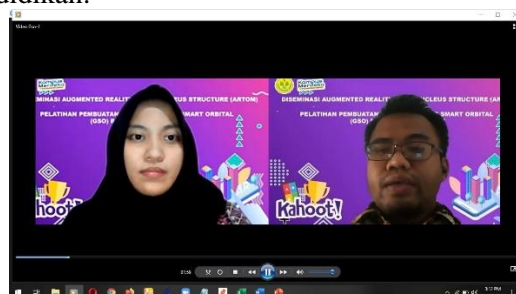
Gambar 4 Pembukaan kegiatan workshop 18 Juli 2021

Koorprodi Pendidikan Fisika FMIPA UNJ dalam sambutannya menyampaikan penghargaan yang tinggi kepada pihak Dinas Pendidikan, MGMP dan SMA atas dukungannya sehingga kegiatan workshop dalam rangkai Program Pengabdian Masyarakat dapat terlaksana dengan baik dan lancar. Kegiatan ini merupakan forum pertemuan antara kampus dengan, stack holder dan mitra UNJ dalam bertukar pikiran menjawab permasalahan dan solusi serta tantangan kedepan khususnya pada bidang Pendidikan.