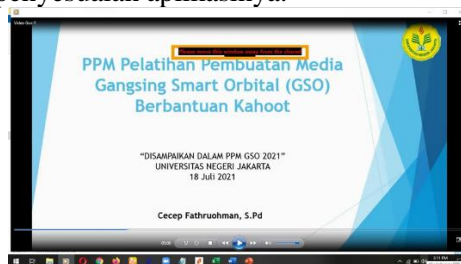
Gambar 5. Penyampaian Materi

Pelaksanaan kegiatan dilakukan dengan terlebih dahulu melakukan paparan materi dasar tentang optik. Guru-guru SMA bidang Fisika pada umumnya telah memahami materi dengan baik dan tinggal melakukan penyesuaian aplikasinya.