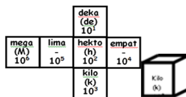
Figure 3. Smart dice design

Penggunaan media ISO dalam proses pembelajaran adalah memperjelas penyajian pesan agar tidak terlalu verbal (berupa kata-kata tertulis atau lisan belaka). Kelebihan media ISO antara lain mampu mengatasi keterbatasan ruang belajar karena belajar bisa dimana saja, mampu mengaktifkan indera dengan tujuan melatih hand on and mind on, mengatasi sikap pasif siswa akibat belajar sambil bermain dan mampu untuk menggambarkan stimulus dan pengalaman belajar bagaimana NASA melakukan misinya ke bulan. Dengan demikian, media pembelajaran ISO dapat digunakan sebagai saluran komunikasi antara guru dan siswa sehingga tujuan pengajaran tercapai. Kelemahan media ISO antara lain keterampilan yang dibutuhkan dalam pembuatan media ini. Selain itu, siswa kesulitan menjalankan media ini jika belum membaca panduan permainan ISO karena media ini merupakan modifikasi dari ular tangga. Dadu pintar adalah dadu berbentuk kubus dan ada satuan ukuran di setiap permukaannya, seperti yang ditunjukkan pada Gambar 5. Dadu biasa memiliki angka atau titik di permukaannya. Satuan yang terdapat pada setiap permukaan dadu pintar menunjukkan nilai (atau jangkauan) dari langkah-langkah yang harus diambil. Dadu pintar terbuat dari kayu atau karet