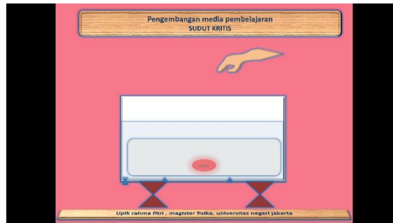
Gambar 1. Tampilan Animasi Sudut Kritis

Perangkat lunak dapat dijadikan sebagai bahan atau media untuk mendukung pembelajaran. Seperti yang ditampilkan pada Gambar 1, penggunaan