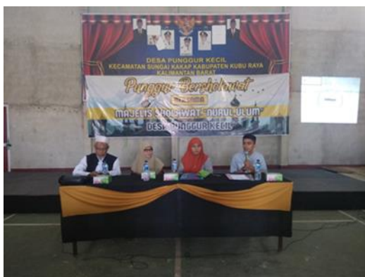
Gambar 1 Tim PKM Tertib Administrasi Kependudukan dari Fakultas Hukum Universitas Tanjungpura

Tim Pengusul PKM dari Fakultas Hukum Universitas Tanjungpura memberikan sosialisasi, penyuluhan dan pendampingan terhadap masalah administrasi kependudukan