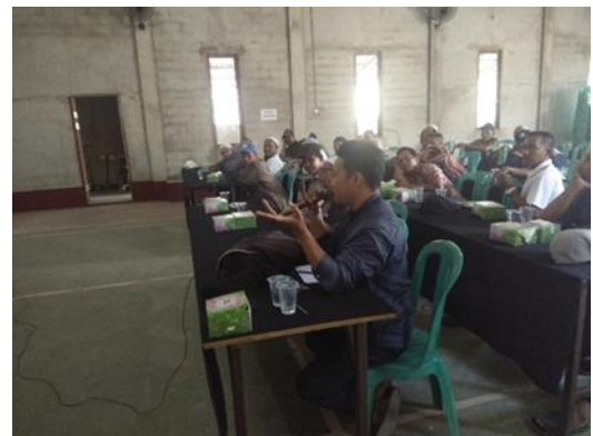
Gambar 4 Warga Desa Punggur Kecil Aktif Berdiskusi dalam PKM Tertib Administrasi Kependudukan