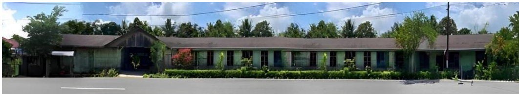
Gambar 1. Fasad depan bangunan Rumah Sakit.

Rumah Sakit Masa Kolonial yang terletak di Kota Pagar Alam ini merupakan salah satu peninggalan penting dari masa kolonial Belanda yang memiliki nilai sejarah tinggi, baik dari segi sosial, budaya, maupun arsitektur. Bangunan ini sudah berdiri sejak tahun 1920 dan didirikan oleh Sembilan Maatschappij (sembilan perusahaan perkebunan Belanda) yang beroperasi di wilayah Pasemah Landen (Tanah Basemah). Rumah sakit ini awalnya berfungsi untuk memberikan layanan kesehatan kepada para