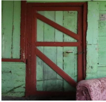
Gambar 4. Pintu dengan motif diagonal yang terdapat pada beberapa bagian bangunan.