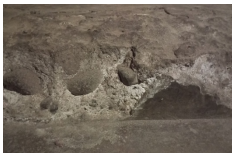
Gambar 3. Lantai bangunan yang telah terkikis dan terlihat komponen batunya.

Pada bangunan ini, terdapat motif diagonal pada beberapa pintu yang hanya terdapat di satu sisi saja. Bangunan ini juga memiliki jendela yang besar dan tinggi, serta pondasi bangunan yang menggunakan material berbahan dari batu kali. Hal ini terlihat dari adanya beberapa area lantai yang bagian pinggirnya telah terkikis sehingga komponen batunya terlihat.