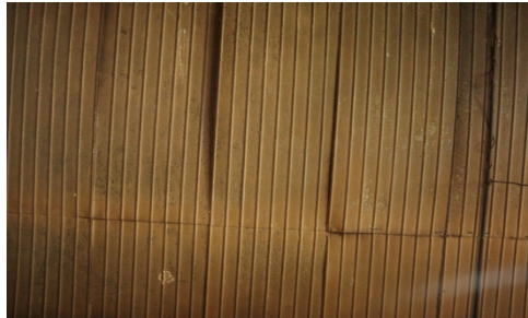
Gambar 2. Plafon bangunan dengan material logam.

ruang tamu ada ruangan yang terdiri dari tiga kamar tidur, gudang, dan ruangan kosong.