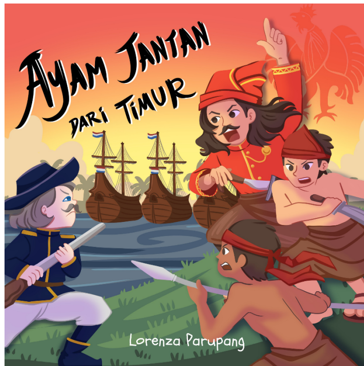
Gambar 5. Produk Buku Cerita Bergambar